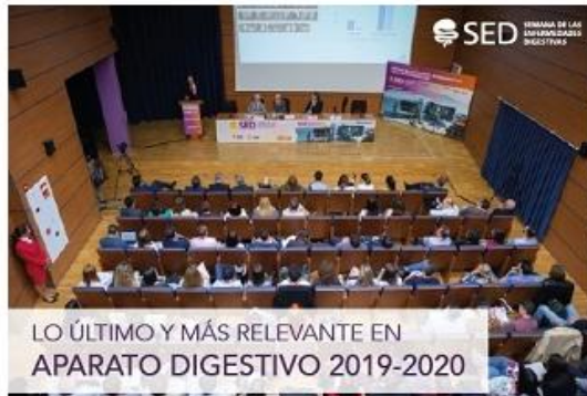
CURSO ABIERTO PARA SOCIOS